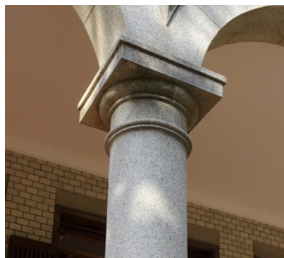
簡素なトスカナ式の柱