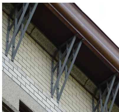
直線的な金属の持ち送り