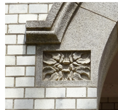
アールヌーボー風のアーチの装飾