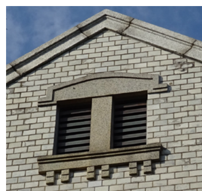
ゼセッション風の幾何学的な換気窓