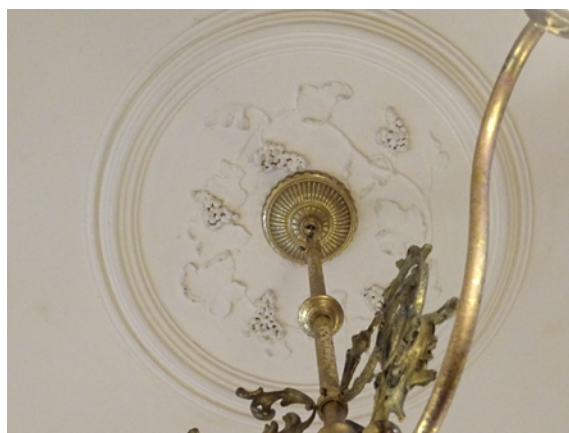
葡萄を模った天井の中心飾り