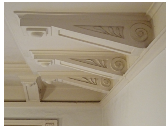
モディリオン（持ち送り） の少し幾何学的な装飾