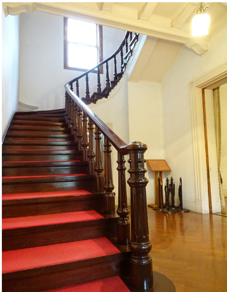
ケヤキの一枚板を使用した階段 ゼセッション風のシンプルな親柱

玄関ホールには当初の秀逸な装飾がよく残されています。アールヌーボー調の有機的な意匠と近代に通じる幾何学的な意匠がバランスよく溶け込んだ、大正時代らしい気風が感じられます。