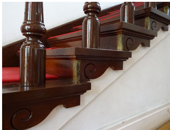
寺社建築に見られる渦模様 のような階段側面の装飾